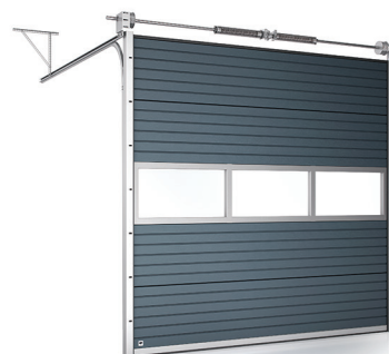
Brama z przeszkleniem