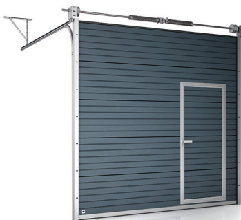
Brama z drzwiami serwisowymi