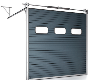
Brama z oknami