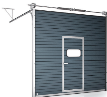
Brama z drzwiami serwisowymi i oknem