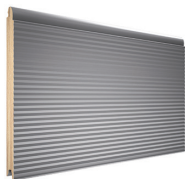
panel z przetłoczeniem V