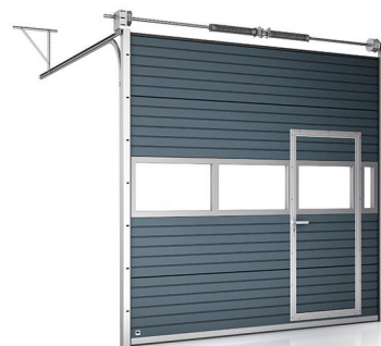
Brama z drzwiami serwisowymi i panelem przeszklonym