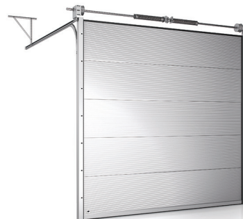
Brama z przetłoczeniem V