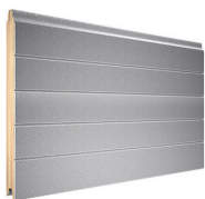
panel z przetłoczeniem deski