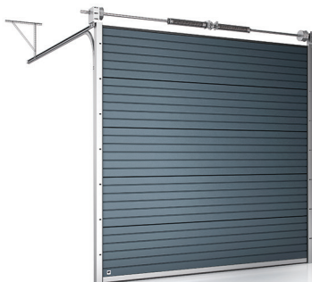
Brama z przetłoczeniem deski